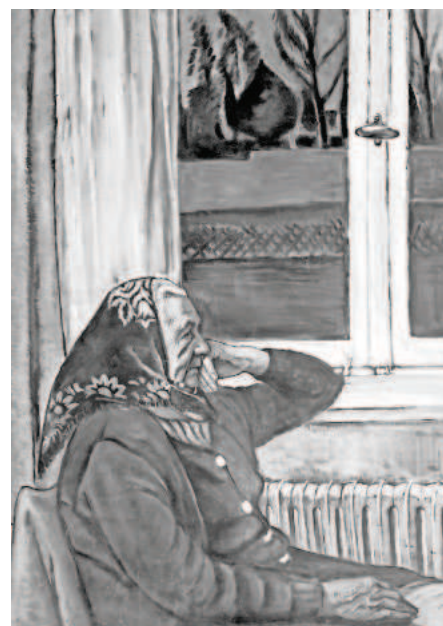
Ferdinand Messner, „Alte Frau“, 1982, Öl auf Leinwand

Die Ausstellung kann zu den Öffnungszeiten des Landratsamtes bis zum 2. November besucht werden. Das erste Künstlergespräch findet am Donnerstag, 11. Oktober 2018 und das zweite Künstlergespräch am Donnerstag, 25. Oktober 2018, jeweils um 16.30 Uhr, im Foyer des Landratsamtes statt.