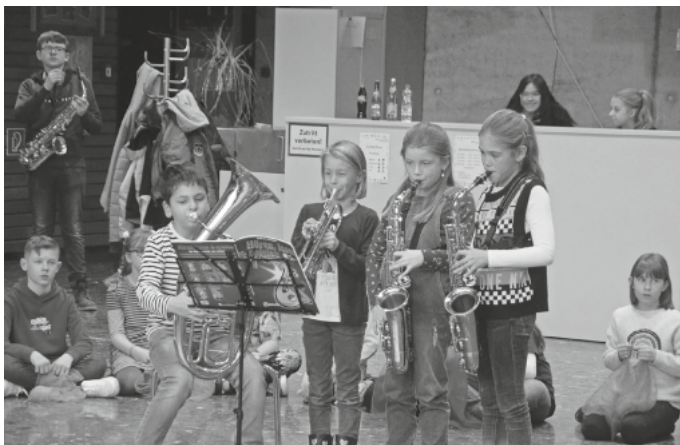
Die Bläsergruppe der Grundschule stimmt musikalisch auf den Tag ein.