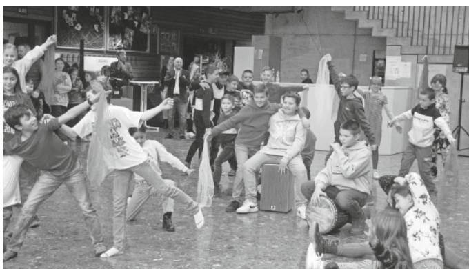
Tanzdarbietung der vierten Klassen unter der Leitung von Andrea Spengler.